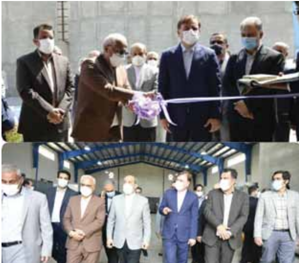
با حضور دبیر شورای عالی مناطق آزاد